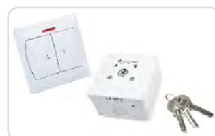
Przełączniki klawiszowe i kluczkowe