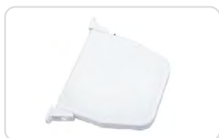
Zwijacze na linkę lub pasek