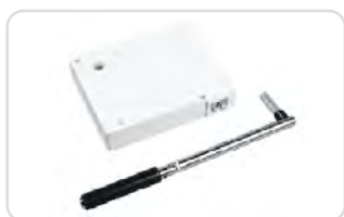
Kasety z przekładnią na linkę lub pasek